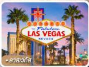
ลาสเวกัส