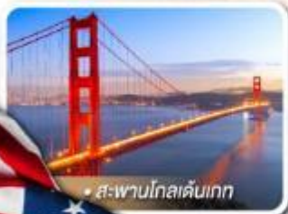
สะพานโกลเดนเกต

★ เยือนอุทยานแกรนด์แคนยอน ฝั่ง South rim ความมหัศจรรย์ทางธรรมชาติ ที่ยิ่งใหญ่ที่สุดแห่งหนึ่งของโลก